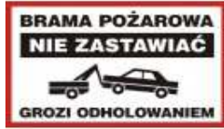
Brama pożarowa NIE ZASTAWIĄĆ